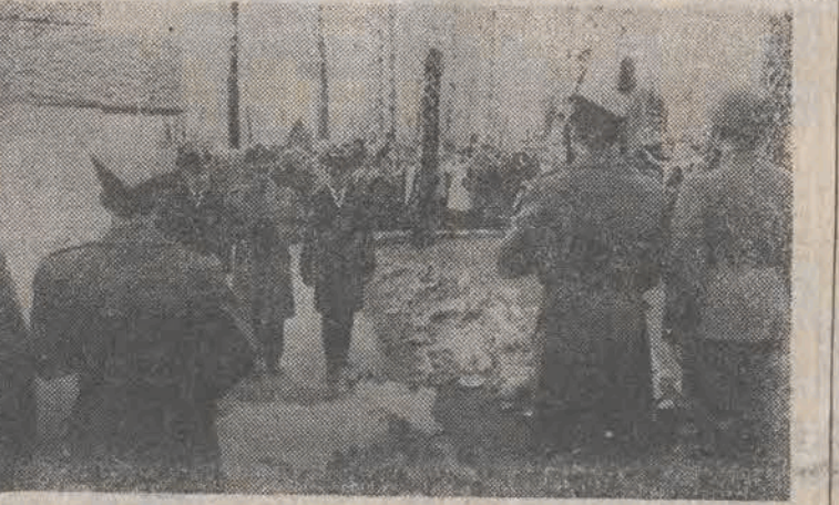
W Warszawie odbyły się uroczystości złożenia urn z ziemią katyńską w Grobie Nieznanego Żołnierza oraz na dawnym omentarzu wojskowym — obecnie komunalnym — na Powązkach.