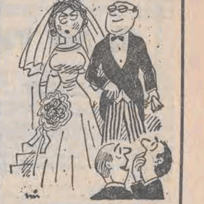
Miłość jest ślepa, wiem, ale czy on także?!