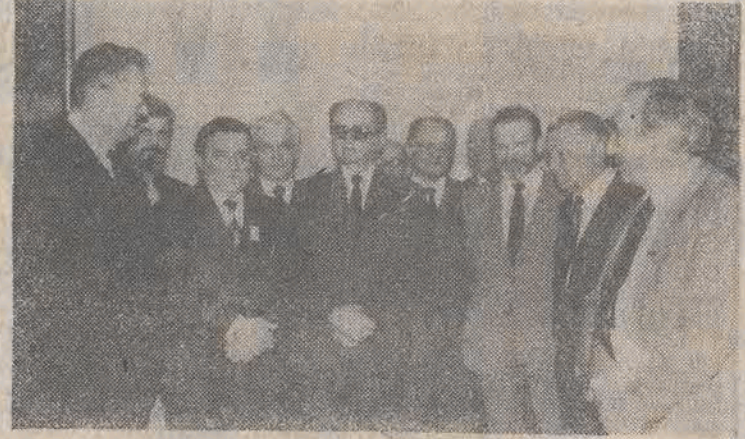
Wczoraj odbyło się w gmachu Sejmu w Warszawie zebranie organizacyjne w sprawie komisji porozumiewawczej, któremu przewodniczył gen. broni CZESŁAW KISZCZAK i LECH WAŁĘSA.

prezesa Rady Ministrów Mieczysława F. Rakowskiego i zastępcy przewodniczącego Rady Państwa Tadeusza W. Młynczaka.