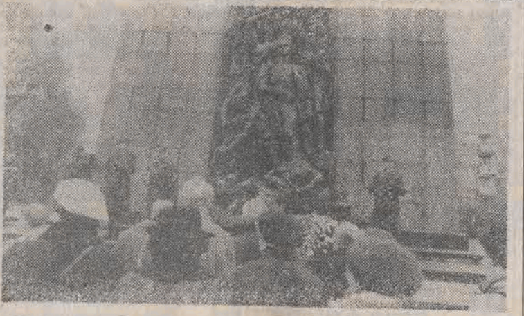
W 45 rocznicę powstania w getcie warszawskim odbyły się w Warszawie uroczystości rocznicowe. Na: składanie wieńców pod pomnikiem Bohaterów Getta.

Przyszedłem się pożegnać — powiedział. — Przeprowadziłem około 300 konferencji prasowych. Pierwszą z nich — 13 grudnia 1981 roku. Stałem się wtedy wyjątkiem, że w Polsce nie dokonał się zamach stanu. Zapowiadałem reformy, ewolucję stosunków w tym kierunku, jaki się ziścił. Po 7 latach i 4 miesiącach odchodzę z tej sali, gdy znajdują się już w niej przedstawiciele „Solidarności”, zadający grzeczne pytania. Dziękuję za współpracę i tysiące interesujących pytań. Na pytania dziennikarzy odpowiadał zastępca rzecznika prasowego rządu dr ZBYSEAW RYKOWSKI, ale przedtem przedstawił informację na temat wtorkowego spotkania komisji porozumiewawczej z udziałem Czesława Kiszcza i Lecha Wałęsy. Utworzenie komisji ustalone zostało przy „okrągłym stole”. Do jej zadań nale- (DALSZY CIĄG NA STR. 2)