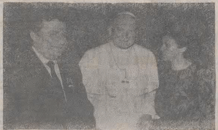
Papież Jan Paweł II przyjął na audiencji prywatnej Lecha Wałęsę i jego żonę Danutę.

Wczoraj papież Jan Paweł II przyjął na audiencji prywatnej przebywającego w Rzymie Lecha Wałęsę. Audiencja trwała 30 min. Według ogłoszonego przez Watykańskie Biuro Prasowe oficjalnego komunikatu, Lech Wałęsa zapoznał papieża z procesem, który doprowadził do legalizacji Związku Zawodowego „Solidarność”, którego korzenie — jak dodał — wywodzą się z doktryny społecznej Kościoła.