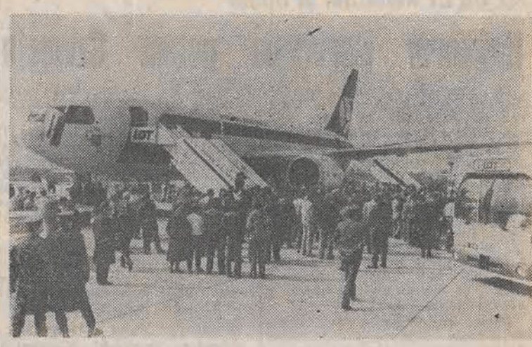
Nz.: Boeing 767 wylądował na warszawskim Okęciu.

Wczoraj przyleciał pierwszy z kilkunastu Boeingów charterowanych przez PLL LOT. Zgodnie z planem o 9.48 minal w powietrzu budynek międzynarodowego dworca lotniczego. Zrobił zwrot i po 10 minutach wylądował z przeciwną stroną betonowego pasa. Osoby czekające na pociąg zaskoczyła cicha praca silników, w przeciwieństwie do hałasu startujących przed chwilą samolotów starszych typów. Nowa maszyna typu B-767-200 ER ma nazwę „Gniezno”. Następnym boeing, który wylądował za miesiąc, ochrzczony zostanie jako „Kraków”.