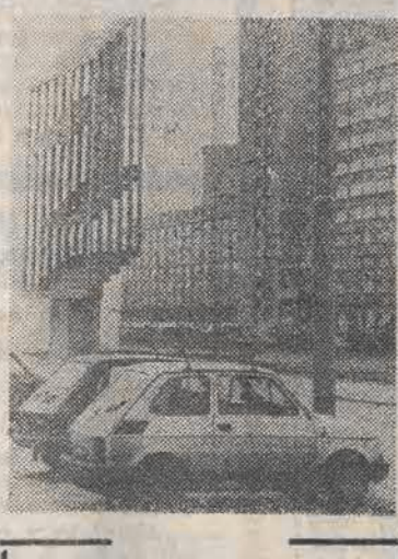
Ten fragment al. Politechniki wygląda interesująco.