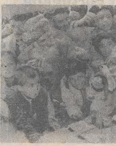
AFGANISTAN. W Kabulu nadal brakuje żywności. Nz.: kolejka do ulicznego sprzedawcy chleba.

W niedzielę nad Nowym Jorkiem omal nie doszło do dwóch katastrof lotniczych. Jak poinformowała Kathleen Bergen, rzeczniczka Amerykańskiego Urzędu ds. Lotnictwa, lecący z Londynu boeing 747 linii lotniczych TWA minal w odległości 30 metrów samolot krajowych linii „Merlin”