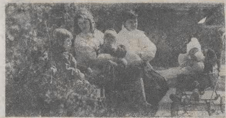
Wypoczynek w parku.