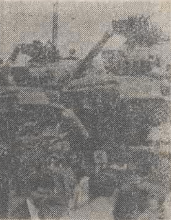
25 km. ze stacji Kiskunhalas na Węgrzech wyruszył pociąg z 31 czołgami radzieckimi. Do końca 1990 r. liczebność stacjonujących na Węgrzech wojsk radzieckich ma się zmniejszyć o około 25 proc.

Minister transportu, żeglugi i łączności wyraził zgodę na nadanie Gdańskiej Stoczni Remontowej imienia Józefa Piłsudskiego. Z wnioskiem wystąpił pod koniec listopada ub. r. organizacja społeczna, rada pracownicza oraz kierownictwo zakładu. Nadanie imienia stoczni nastąpi najprawdopodobniej 12 maja br. w 54 rocznicę śmierci Józefa Piłsudskiego.