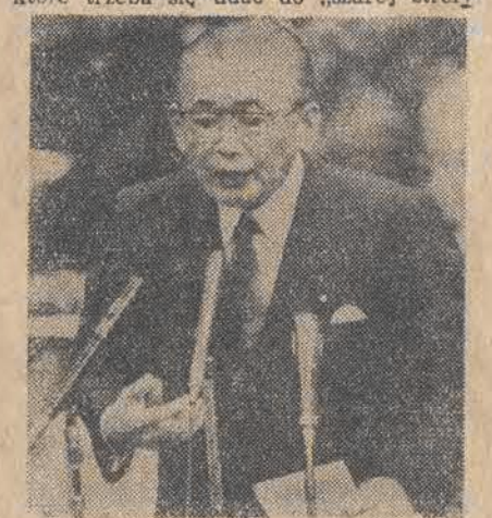
Premier Takeshita próbuje się bronić...

Oblicza się, że poseł do parlamentu musi mieć na wydatki około 900 tys. dolarów. Rząd daje mu w formie pensji 150 tys. Pozostałe 750 tys. to według Japończyków „niebezpieczne pieniądze”, po które trzeba się udać do „szarej strefy”