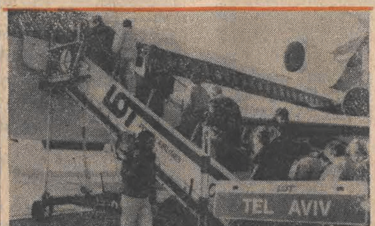
Już od ponad miesiąca działa stała linia lotnicza Warszawa — Tel-Awiv.

Na zaproszenie przewodniczącego CK SD Jerzego Józwiaka przybył z kilkudniową wizytą do Polski przewodniczący EDP z Republiki Federalnej Niemiec Otto Lambsdorff. Szef partii wolnych demokratów i towarzyszące mu osoby przeprowadziły rozmowy w Ministerstwie Współpracy Gospodarczej z Zagranicą na temat perspektyw tej współpracy między Polską i RFN.