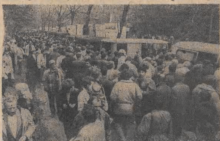
Sar hod... st agaty b... ki... Na zak... y za... sze jest odpowiednia para, zwłaszcza, że handel i gastronomia przygotowali wczoraj wiele atrakcji.

W poniedziałek tradycji stało się za- dość. I tej oficjalnej — w postaci godnego uczczenia święta klasy ro- botniczej — i tej związanej z au- rą. Musiało koncertować oraz dwie es- trady — jedna przy ul. Krzemie-