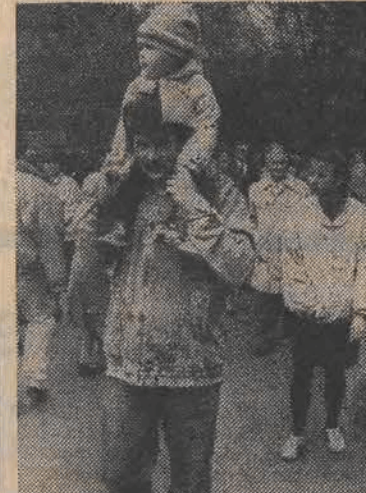
...a teraz kupisz mi watę na pa- tyku i posłuchamy jak śpiewają...