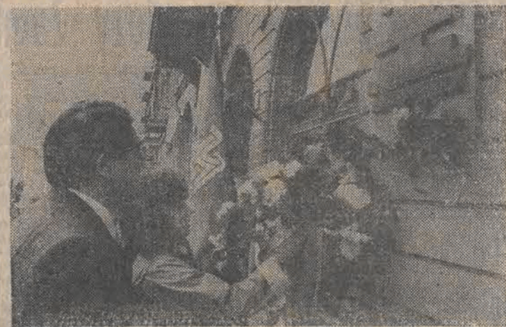
Na zdjęciu: podczas uroczystości przed siedzibą ŁK SD.