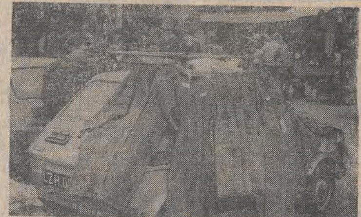
Było już różne rekordy związane z popularnym maluchem. Ten właściciel fiacika również może uważać się za swego rodzaju rekordzistę. (wach)

W wypadku „Elektromontażu” spółka będzie, dając dodatkową produkcję, pracować na rzecz przedsiębiorstwa. (ap)