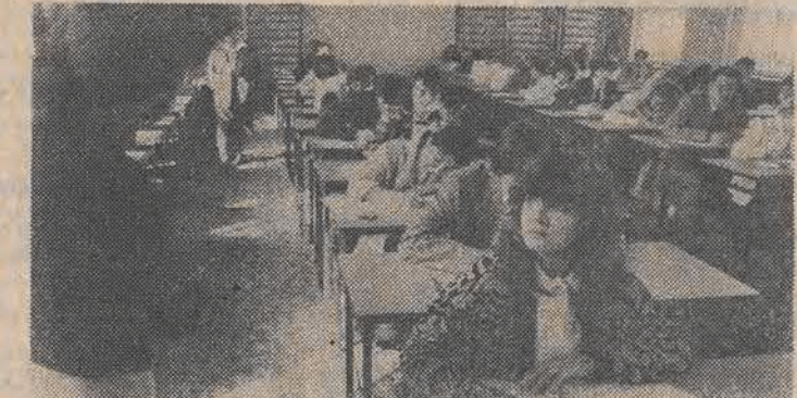
Na zdjęciu: egzamin w XXI LO.

A oto tematy — dla profili: ogólnego, matematyczno-fizycznego, biologiczno-chemicznego i klasycznego: 1. Polaków portret własny w literaturze romantyzmu i Młodej Polski; 2. Obserwacje ludzkich postaw i technika ich pisarskiego przedstawienia w wybranych utworach literackich okresu 20-lecia międzywojennego; 3. W poszukiwaniu wzorca uczuć i myśli dzisiejszego człowieka — które z postaci literackich lub filmowych są najbliższe twoim idealom?