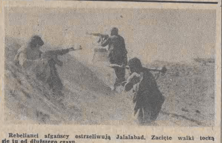
Rebelianci afgańscy ostrzeliwują Jalalabad. Zacięte walki toczą się tu od dłuższego czasu.