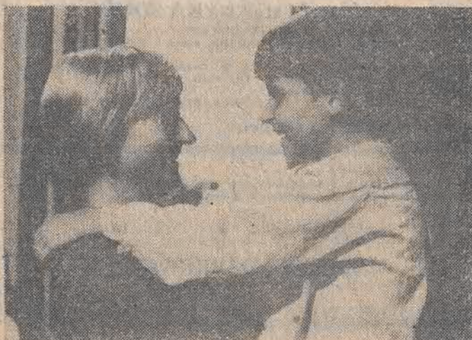
Kadr z filmu „Wojenne dzieciństwo”.