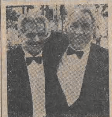
Omar Sharif i Anthony Quinn w Cannes, gdzie 11 bm. rozpoczął się Międzynarodowy Festiwal Filmowy.

Dla zmotoryzowanych turystów. (DALSIY CIĄG NA STR. 2)