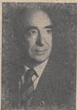
Socjalizm wykreślił kupiectwo z listy zawodów. Szanowaną przez dziesiątki lat nazwę kupiec zamieniono na mniej szacowane i o wiele mniej mówiące określenie — handlowiec...