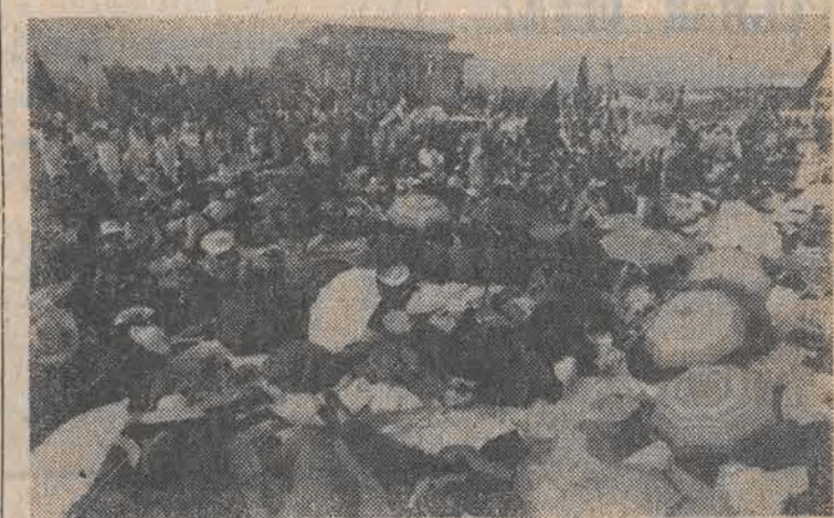
Już od trzech dni trwa strajk głodowy studentów pekińskiego uniwersytetu na placu Tiananmen. Studenci domagają się reform demokratycznych. CAF — AP

Jeśli ludzie odpowiedzialni za Wyścig Pokoju, za jego charakter sportowy, nadal będą upierali się przy takiej formule rywalizacji, nie to dobrej majowej imprezie nie przyniesie. Zachód przysłał będzie siódme czy ósme „garnitury”, a Wyścig Pokoju zamiast zyskiwać na randze tracić będzie dotychczasowy dorobek. Z roku na rok będzie się stawał imprezą prowincjonalnej rangi, mimo międzynarodowości ich pilnują. (DALSIY CIĄG NA STR. 2)