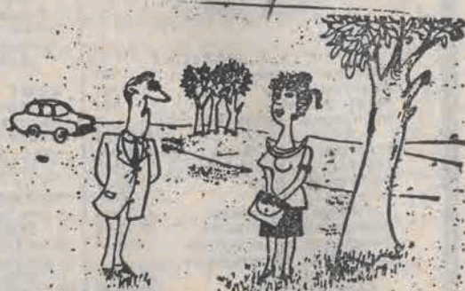
— Co za hańba! Dowiedziałem się, że moja żona spotyka się z twoim mężem.