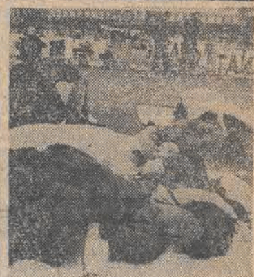
CHINY. Studenci nadal okupują plac Tiananmen w Pekinie. Nt.: zmęczeni demonstranci śpią na placu.

dało przynajmniej jeden program z tego cyklu. Widzowie warszawscy zapytani, która część „Studia wyborczego” podoba im się bardziej: przygotowana przez TVP, czy przez „Solidarność”, stwierdzali najczęściej, że nie widzą między nimi różnicy (41 proc. takich odpowiedzi). 28 proc. zapytanych uznało za lepszą część „Studia wyborczego” przygotowaną przez „Solidarność”, 13 proc. — przeciwnie, wskazało w odpowiedzi na autorów z Telewizji Polskiej. Pozostali nie mieli w tej sprawie sprecyzowanego zdania.