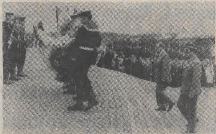
Prezydent Francji Francois Mitterrand i generał Wojciech Jaruzelski składają wieńce na Westerplatte.