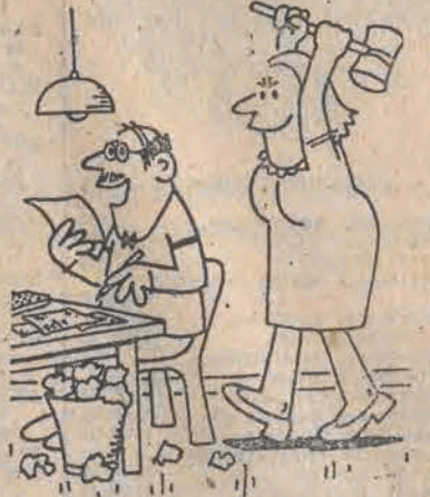
— Gąbby teraz coś mi się przytrafiło, została bym bardzo bogatą wdową...

drugiego skazanego 110 paczek papierosów, placąc mu sfałszowanym banknotem 5-tygodniowym. Ponieważ kręciactwo się szybko wydało, od razu można było przystąpić do karania, ponieważ obsługa prokuratorska była na miejscu.