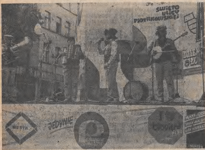
Kapela „Łodzianka”. Wtedy jeszcze nie padało.