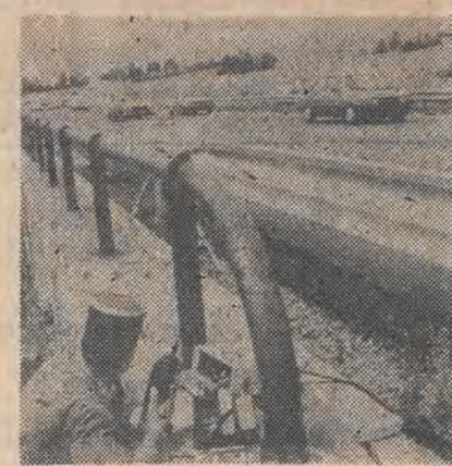
Radarowa pułapka francuskiej policji.

18 — rock w dobrym guście (zespół „Runway”).