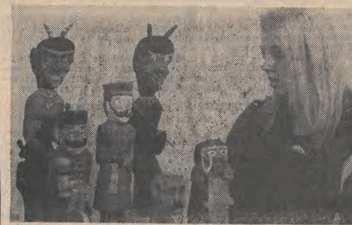
Dziewczyna i diaby.