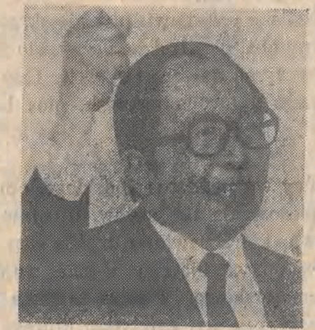
Premier Uno zapowiada energiczną politykę.