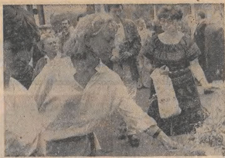
Mieszkańcy Budapesztu składają ostatni hołd straconemu w 1956 roku premierowi Węgier Imre Nagy'owi i jego współpracownikom.