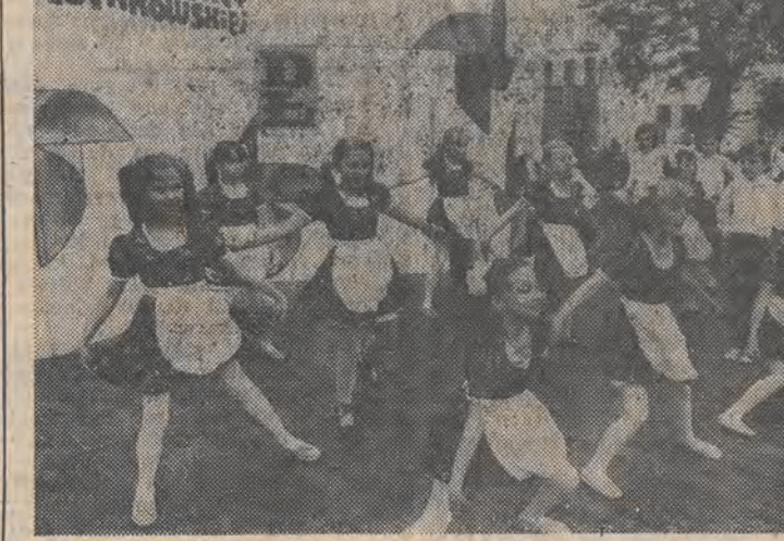
Masa wdzięku, czyli zespół „Sikorki”.

17 — spektakl piosenek i humoru (szmoncesy) — „Przy szabasowych światełkach” w wyk. aktorów scen