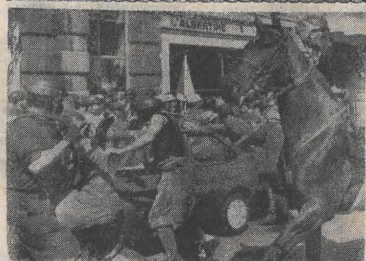
W Brukseli doszło do starć z policją grupy górników protestujących przeciwko zamknięciu dwóch ostatnich kopalni węgla w Limburgii. 48 osób zostało rannych.