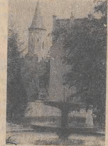
Malowniczy fragment Pabianic.