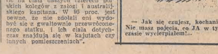
— Jak się czujesz, kochanie? Nie masz pojęcia, co JA w tym czasie wycierpiałem!...