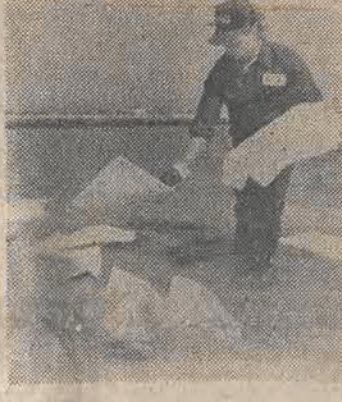
USA. Trwa operacja usuwania ropy, która wyciekła z uszkodzonego greckiego tankowca „World Prodigy” w pobliżu Newport. NZ: rozkładanie materiału absorbującego ropę.

sobie przygotować kawę. Po bardzo silnym zderzeniu nasz statek natychmiast przewrócił się na bok a następnie do góry dnem. Trwało to zaledwie 40 sekund. Zdołałem wydostać się poza pomieszczenia statku i powoli ze sporej głębokości wypłynąć na powierzchnię. To samo udało się koleżance Rezelrowi. On w chwili zderzenia spał, ale obudził się i natychmiast wy-