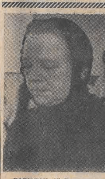
PAKISTAN. W Peszawarze przebywała delegacja matek radzieckich jeńców przetrzymywanych przez rebeliantów afgańskich, aby wynegocjować warunki uwolnienia ich synów.

(INF. WŁASNA. Gospodarcza wolność owocuje w najrozmaitszych dziedzinach. Jej bardzo młodym, dopiero raczkującym dzieckiem jest pierwsza w Łodzi prywatna gazeta, „To and owo”, w zamierzeniu tygodnik, na razie zaś dwutygodnik informacyjno-reklamowo-ogłoszeniowy. Założyła go istniejąca zaledwie od trzech miesięcy Agencja Promocyjna „Midas” spółka z o.o., której siedziba mie-