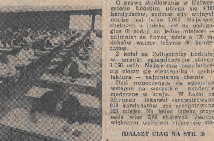
Na zdjęciu: studiowanie prawa zawsze wydawało się zajęciem atrakcyjnym. W tym roku o 230 indeksów ubiega się 428 osób.

Rozpoczęły się egzaminacyjne emocje. Wczoraj batalię o indeksy zainaugurowali kandydaci na wyższe uczelnie podległe resortowi edukacji narodowej. Rozpoczęto sprawdzianem pisemnym z przedmiotu kierunkowego, dzisiaj zaś przyszli studenci popisywać się będą znajomością wybranego języka obcego.