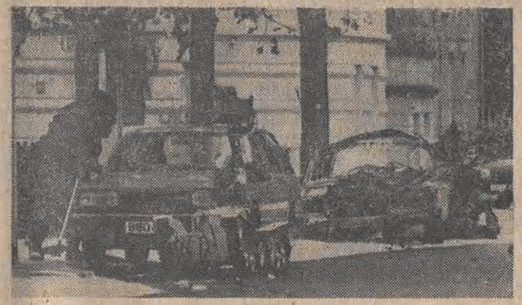
Wybuch bomby podłożonej w samochodzie pułapca w Hanowerze zabił brytyjskiego żołnierza, zranił jego żonę i 3 dzieci. Druga bomba została znaleziona w pobliżu. Na zdjęciu: zachodniemiecki policjant przeprowadza inspekcję na miejscu terrorystycznego zamachu.

Sąd Najwyższy USA w znacznym stopniu ograniczył prawo Amerykanek do przerywania ciąży przyznając władzom stanowym o wiele większe możliwości decydowania w tej kwestii w wyniku czego uzyskiwanie zgody na zabieg może być utrudnione. Jednakże sąd odrzucił wniosek rządu George'a Busha o uchwienie podjętej 16 lat temu decyzji w sprawie legalizacji aborcji.