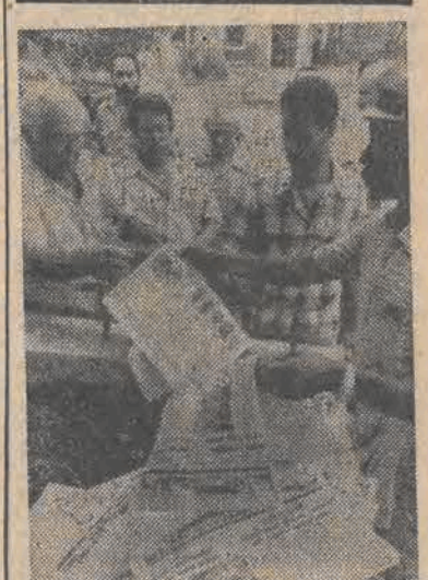
KUBA. Mieszkańcy Hawany kupują partynę dziennik GRANMA z wiadomościami z procesu byłych oficerów oskarżonych o handel narkotykami. Prokurator domaga się kary śmierci dla przestępców.