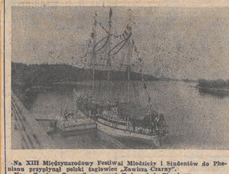
Na XIII Międzynarodowy Festiwal Młodzieży i Studentów do Phenianu przypłynął polski żaglowiec „Zawisza Czarna”. Nż. „Zawisza Czarna” na reece Tadong koło Pheniana.

nie do Państwowego Monopoli Loteryjnego. Dopiero tam dowiedział się, że los jest sfałszowany. W Warszawie „na pocieszenie” okazano mu całą kolekcję fałszywych losów, które zostały odkupowane po różnych „okazyjnych” cenach... opr. kp.