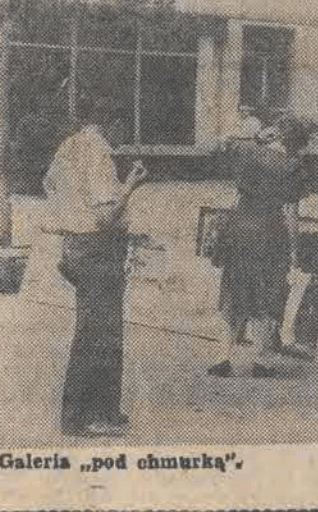
Galeria „pod chmurką”.