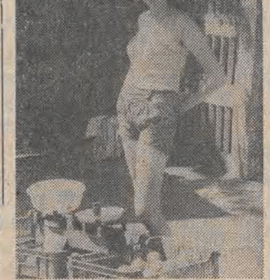
Frontem do klienta.

Gratulujemy dzieciom i ich rodzicom! W. M.