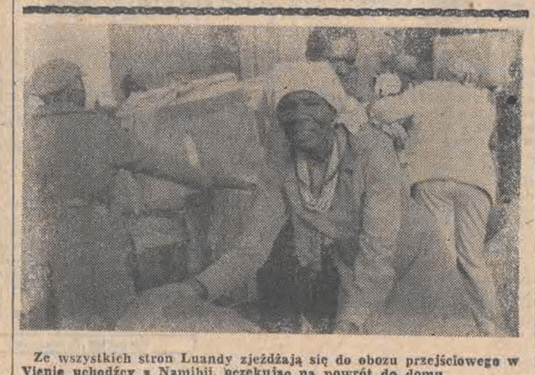
Ze wszystkich stron Luandy zjeżdżają się do obozu przejściowego w Wienie uchodźcy z Namibii, oczekujący na powrót do domu.

Kierownictwo restauracji hotelu „Hilton” w Mediolanie wprowadziło nowy system opłat za konsumpcję, motywując te decyzje troską o czas klientów. Obecnie kelner nie sumuje cen poszczególnych dań zamówionych przez konsumentów, ale wystawia rachunek w zależności od czasu, w jakim klient spożywał posiłek. Ustalona stawka — tysiąc lirów za minutę. Doświadczenia wykazały, że statystyczny konsument może w ciągu 30 minut zjeść zakąskę, dwa gorące dania, deser i wypić filiżankę kawy. To w zupełności wystarczy — twierdzą pracownicy restauracji „Hilton” w Mediolanie, by zaspokoić głód, chyba, że chce się trafić do słynnej księgi Guinnessa. Opr. kp.