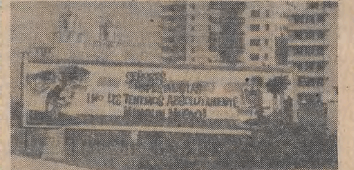
„Panowie imperialiści, absolutnie się was nie boimy!”

wzdłuż starej i nowej części Hawany od strony oceanu. Zaczyna się u wejścia do Zatoki Hawańskiej, którego strzeże pontura forteca El Morro, w XIX w. przemieniona na ciężkie więzienie, a obecnie powoli, ale systematycznie rozszypująca się pod wpływem wilgotnego klimatu. Na drugim końcu Maleconu leży niewielki zameczek Chorrera, niegdyś strzegący uj-