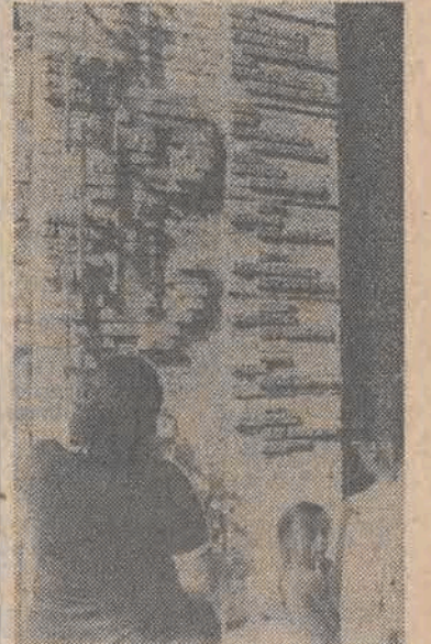
30 lipca br. z okazji 45 rocznicy powstania warszawskiego w Alei Zasłużonych cmentarza na Powązkach nastąpi odsłonięcie pomnika ufundowanego z inicjatywą „Społeczny Komitet Uczczenia Pamięci generała Grota i Jego Żołnierzy”.