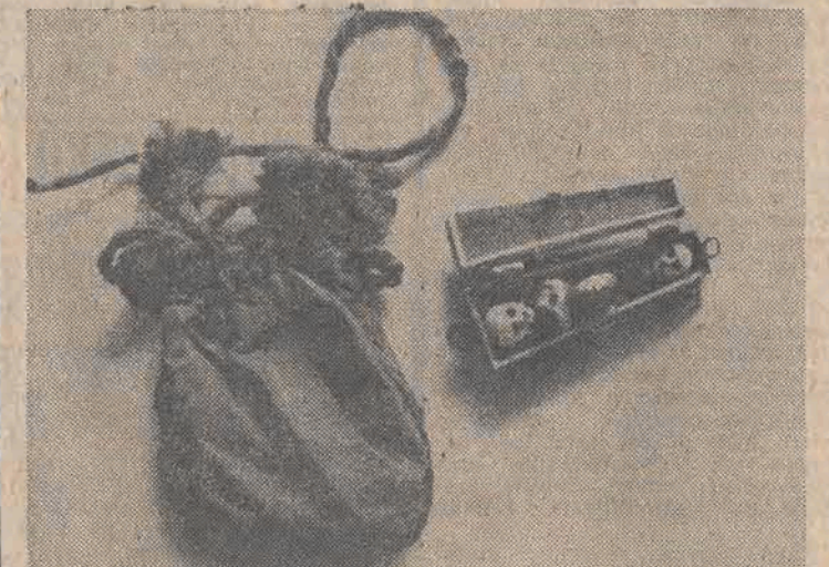
W krypcie grobowej Piastów Brzeskich w Brzegu (Opolskie) znaleziono biżuterię złota z poł. XVII w. Są to: 2 obrączki, pierścionek oraz miniaturowy sarkofag. Ten cenny znalezisko w przyszłym roku eksponowane będzie w Muzeum Piastów Śląskich w Brzegu. Na 11 miniaturowy sarkofag wraz z mieczem.

Również 1 sierpnia zostaną podwyższone średnio o 20 proc. opłaty taryf towarowych: PKP, transportu samochodowego i spedycji PSK, żeglugi śródlądowej i komunikacji kolejowo-żeglugowej.