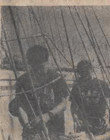
Barkentyna „Pogoria” po rejsie dookoła świata, wypłynęła z portu Gdynia z młodzieżą kanadyjską w roczny rejs — tzw. „Szkoły pod żaglami”. Nz.: Młodzież kanadyjska zapoznaje się ze statkiem, przed wyruszeniem w rejs.