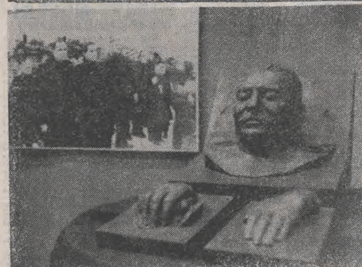
Maska pośmiertna Stalina jest jednym z wielu eksponatów na otwartej i bm. w Moskwie wystawie „Chruszczow, tamto 10 lat”. Wiele pokazanych tu eksponatów nigdy nie było udostępnianych publicznie aż dotąd.