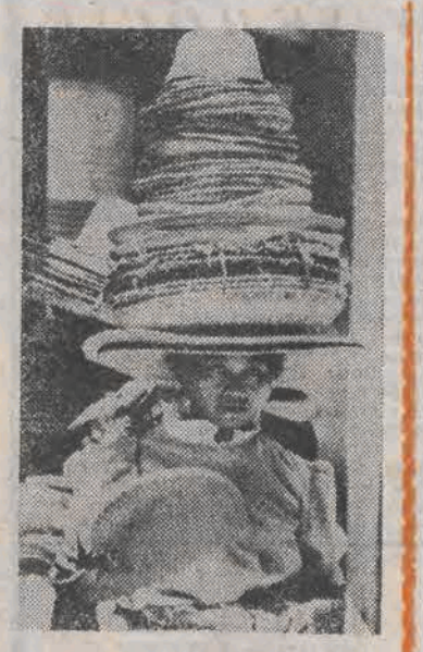
Uliczna sprzedawczyni słomkowych kapeluszy w Manili...