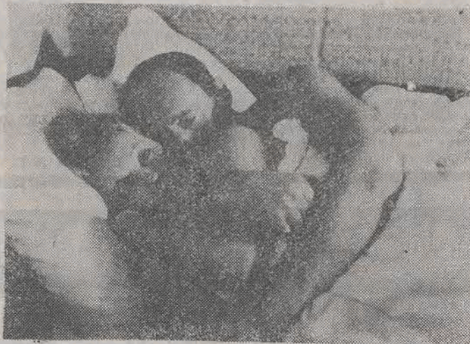
Scena z filmu „Konsul”.

W latach postaliniowskich na Węgrzech toczy się akcja filmu