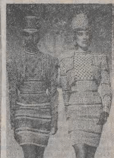
Autorem tych oryginalnych strojów jest czolowy projektant saudyjski Yahya Al Bishri. Zaprezentował je w Paryżu podczas pokazów kolekcji jesienno-zimowych 1989/90.