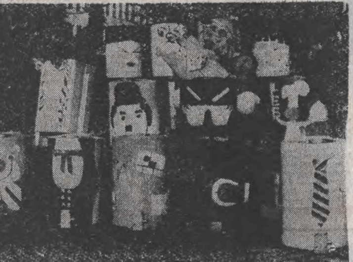
Okazuje się, że nawet kosze do śmieci mogą wyglądać zabawnie...