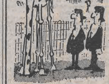
— To chyba skrzyżowanie ściany ze strusiem?