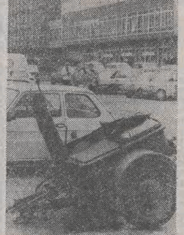
Bedzie konkurencja dla „Kaskady”?

Rozmierzilibyśmy się z naszymi piszacz, że w sobotę w centrum miasta pieczywa nie można było kupić (było np. w „Centralu” i w