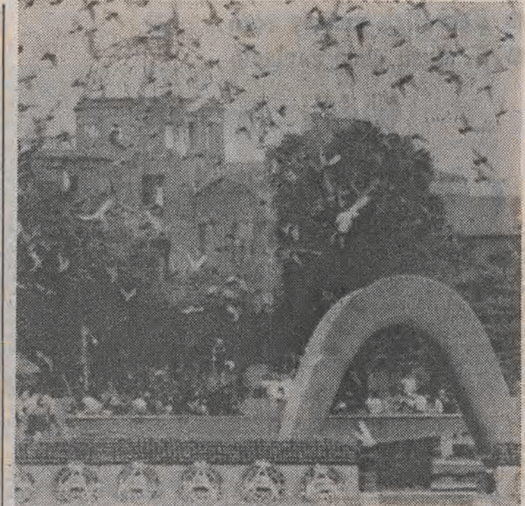
W Hirozsimie odbyły się obchody 44 rocznicy zrzucenia pierwszej bomby atomowej na to miasto. Na zdjęciu: gołębie symbolizujące pokój nad pomnikiem ofiar bombardowania.