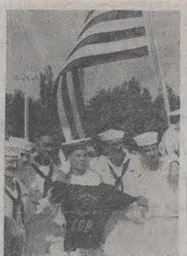
W Sewastopolu przebywa z oficjalną wizytą grupa amerykańskich okrętów. Na zdjęciu: amerykańskie okręty radzieckich i amerykańskich marynarzy.