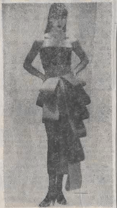
Czarna waska suknia ozdobiona kaskadą wielobarwnych kokard to projekt domu mody Cardin na sezon jesiennie-zimowy.