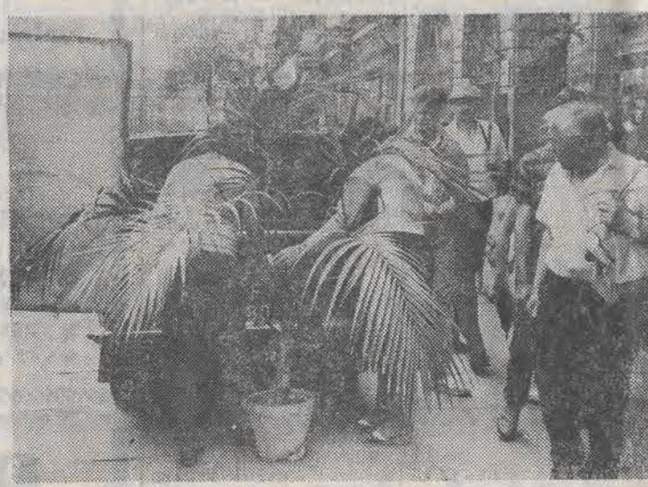
No i będą wakacje pod palmą...

nej zimy doczeka się wymiany okna. (j. kr.)