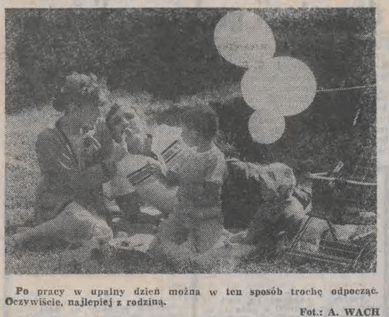
Po pracy w upalny dzień można w ten sposób trochę odpocząć. Oczywiście, najlepiej z rodziną.

Ta sama prokuratura prowadzi śledztwo w podobnej sprawie 32- letni Lesław B.