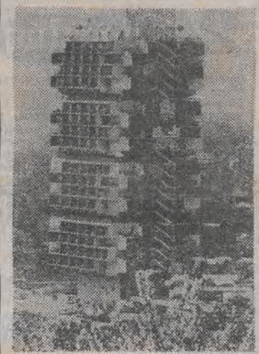
Originalna budowla sanatoriumu w Sochi. Napis przypominia, że ten słynny kurort obchodzi 150-lecie istnienia.

nia, naturalnego dążenia do demokracji, wolności, a wkroczenie polskich sił zbrojnych do CSRS odbyło się bez przyzwolenia polskiego społeczeństwa.