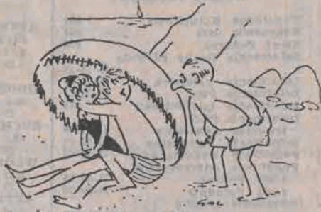
— To pańska żona? Och, przepraszam bardzo, ale bez okularów źle widzę...

◆ PIĘCIOLETNI CHŁOPIEK przez 20 minut leżał na dnie jeziora Maggiore w Szwajcarii. Odnalazł go tam pletwonurek, penetrujący dno na głębokości 30—40 metrów. Przypadkiem na brzegu znalazł się lekarz. Dzięki zastosowaniu sztucznego oddychania, chłopcu uratowano życie.