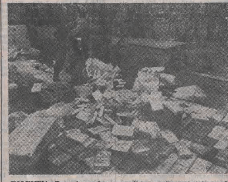
KOLUMBIA. Trwa bezpardonowa walka z mafią narkotykową. 24 bm. przechwycono ponad dwie tony kokainy na zarekwirowanym mafijnym bossom rancho. N.z.: kokaina przed spaleniem.