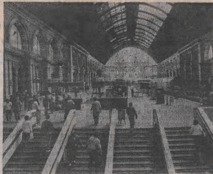
Takich dworców jak ten w Budapeszcie zachowało się już w Europie niewiele.