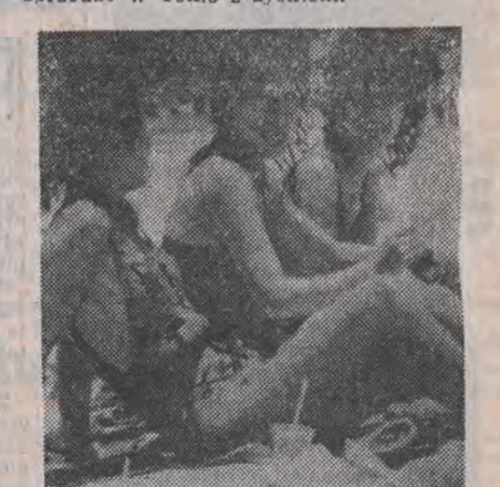
Na zdjęciu: japońskie grajce na australijskiej plaży.

Tokio. Stąd kalkulacje wielu wyjeżdżających są „polskie” — przy umiejętnych zakupach zwracają się koszty podróży i pobytu, bo przywiezione towary można sprzedać w Tokio z zyskiem.