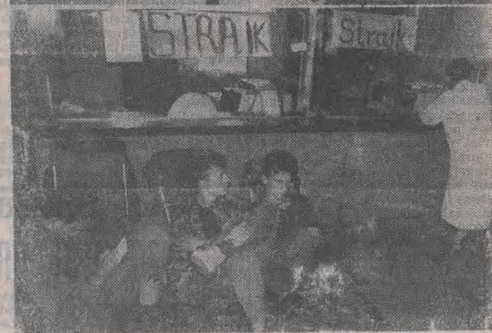
Tak wyglądał wczoraj Dworzec Fabryczny. Wymarłe perony, a w poczekalni kocujący podróżni, którzy mają nadzieję, że strajk się skończy i będą mogli odjechać z Łodzi.