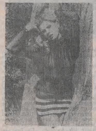
Szkoda, że lato się kończy