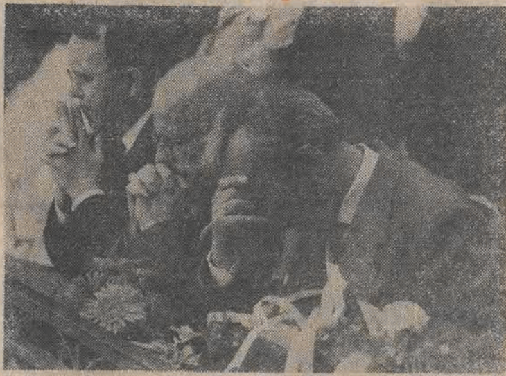
Premier Tadeusz Mazowiecki wraz z gościem z RFN Norbertem Bluemem i innymi osobistościami uczestniczył w mszy świętej na Jasnej Górze, celebrowanej przez prymasa Polski Józefa Glempa.

Z udziałem tysięcy pielgrzymów z kraju i zagranicy 26 bm. na Jasnej Górze w Częstochowie odbyły się uroczystości religijne związane z świętem Matki Boskiej Częstochowskiej.