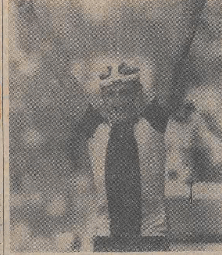
Bardzo szczęśliwa dla polskiego kolarstwa była minioną sobota. W Chambery (Francja) po torowcach przystąpili do walki o medale sz-

sowcy. Nasze medalowe apetyty pobudził zdobyty w śródownym wyścigu drużynowym srebrny medal. Po cichu liczyliśmy, że uda nam się zdobyć chociażby brązowy krążek w wyścigu indywidualnym. Ale to co się stało w sobotnie popołudnie przeszło nasze najśmielsze oczekiwania. Amatorskim mistrzem świata, po samotnej i wspaniałej ucieczce, na 180-kilometrowej tra-