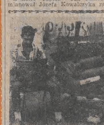
LIBAN. Oddziały prosyryjskie, rozstawione wzdłuż tzw. zielonej linii dzielącej Beirut, prowadzą ostrzał dzielnic chrześcijańskich m.in. z takich wyrzutni rakietowych.