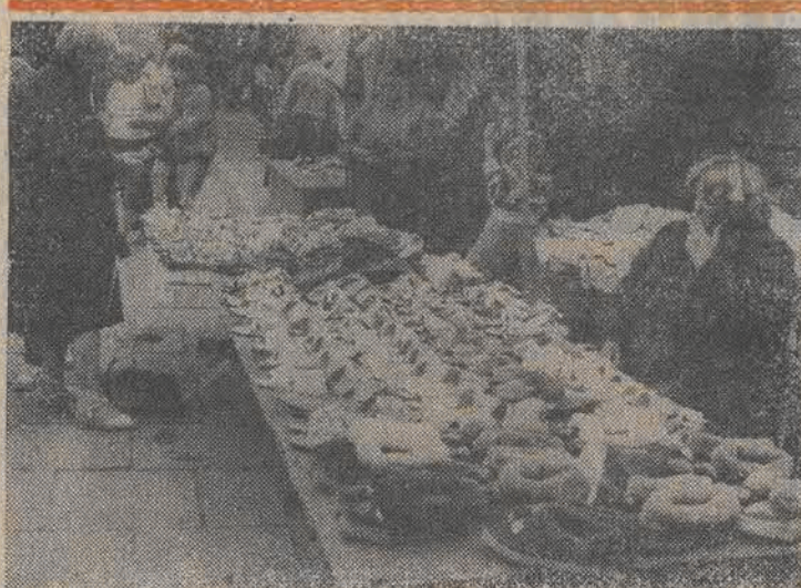
Skórzane pantofle domowe oferowane przez sprzedawców na targowisku przy zbiegu ulic Piotrkowskiej i Andrzeja Struga, to wyroby ładne i trwałe ale drogie. Para kosztuje kilkanaście tysięcy złotych.