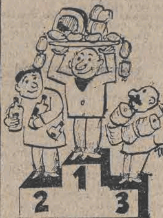
Laureaci kolejkowego festiwalu, czyli jak miał trzecie? rys. A. Bieńkowski