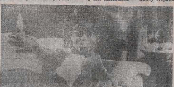
Odpozynek riksarsza na jednej z ulic Katmandu — stolicy Nepalu.