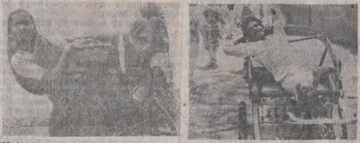
Kobiety w Bangladeszu noszą kuzami ziemi do budowy tamy.