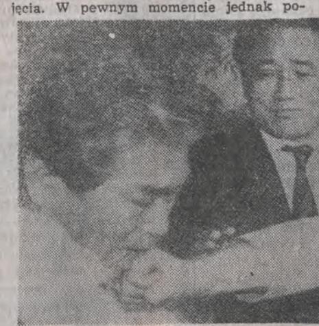
Prawym prostym nie zwycięża się w dyskusji.

Dyskutowano na temat zakończonych dopiero co wyborów uzupełniających. Opozycja zarzucała partii rządzącej oszu- stwa czyli cuda nad urną. Padły mocne słowa z obu stron, co jest do przy- jęcia. W pewnym momencie jednak po-