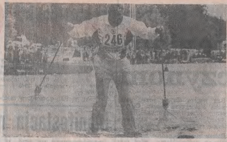
Finowie lubią narty — nawet takie, którymi „chodzi się” no wodzie.