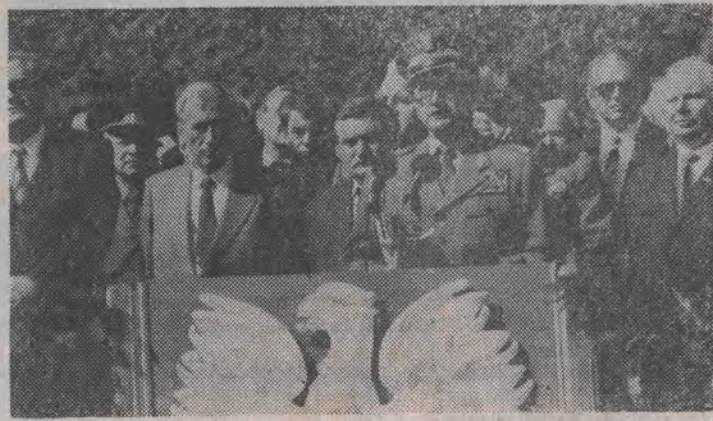
Nz.: prezydent Wojciech Jaruzelski wygłasza przemówienie.

Po południu na Westerplatte od- były się uroczystości religijne. Pod- czas uroczystości bp T. Gocłowski pościelił mogiły westerplattejskich i krzyż wznoszący się nad history- cznym cmentarzem.