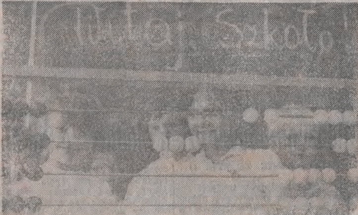
Pierwszoklasiści ze Szkoły Podstawowej nr 111 przy ul. Jaracza 44/46.

W oddanej dopiero do użytku, pachnącej jeszcze świeżą farbą Szkoła Podstawowej nr 3 w Pabianicach odbyła się wczoraj uroczysta wojewódzka inauguracja nowego roku oświatowego 1989/90, z udziałem przedstawicieli władz Łodzi, Pabianic oraz MEN.