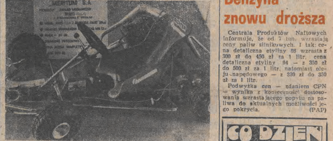
52 Targi Krajowe Jesień 89. Milion złotych z początku szokuje — cena za gokarta — ale jak się zastanowić, że rower turystyczny to prawie dwieście tysięcy to ten pojazd wydaje się niedrogi.

Targi Krajowe „Jesień '89” POZNAŃSKIE ABSTRAKcje (Obsługa własna) W Poznaniu można zobaczyć dwie duże abstrakcyjne wystawy: Picassa którego kilkadziesiąt prac na papierze prezentuje tutejsze Muzeum Narodowe oraz ekspozycję artysty wystawy bez pokrycia — nie dotyczy produktów z „odzieży”. Na targach zabrakło także producentów obuwia tkanin, części spódzienia, części wtyrników sprzętu mechanicznego — np. nie przyjechał „Zelmer”, „Lucznik”, „Niewiadów”. W sumie ich oferta jest (DALSIY CIĄG NA STR. 3)