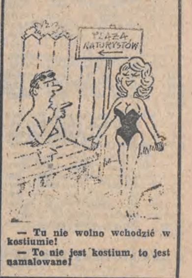
— Tu nie wolno wchodzić w kostiumie! — To nie jest kostium, to jest kamalowane!

Imieniny obchodzą Melchior, Regina, Hadrian, Ryszarda Dyżurny synoptyk w dniu dzisiejszym przewiduje dla Łodzi następującą pogodę: zachmurzenie na ogół umiarkowane. Temp. maks. w dzień około 21 st. Wiatr słaby i umiarkowany zachodni. O godz. 19 ciśnienie wynosiło 1001,7 hPa (751,4 mm Hg), a temperatura 16,6 st. Z kalendarza wydarzeń 1939 — Kapitulacja Westerplatte. Taka sobie myśl Kłótnia strata czysta! Bo gdzie dwóch się kłóci tam trzeci korzysta. Uśmiechnij się