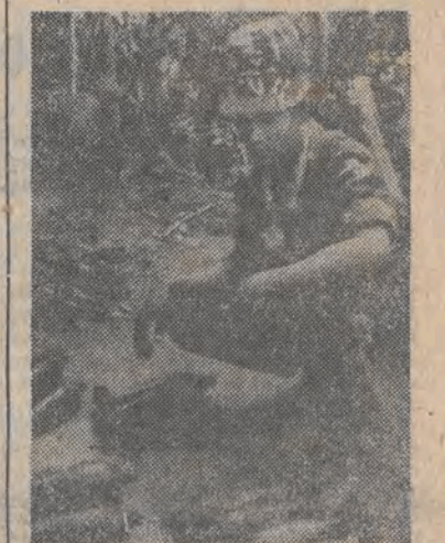
W obozach Czerwonych Kmerów na granicy kambodżańsko tajlandzkiej trwają przygotowania do akcji wojskowych, mających rozpocząć się dziś, po wycofaniu z Kambodży oddziałów wietnamskich.