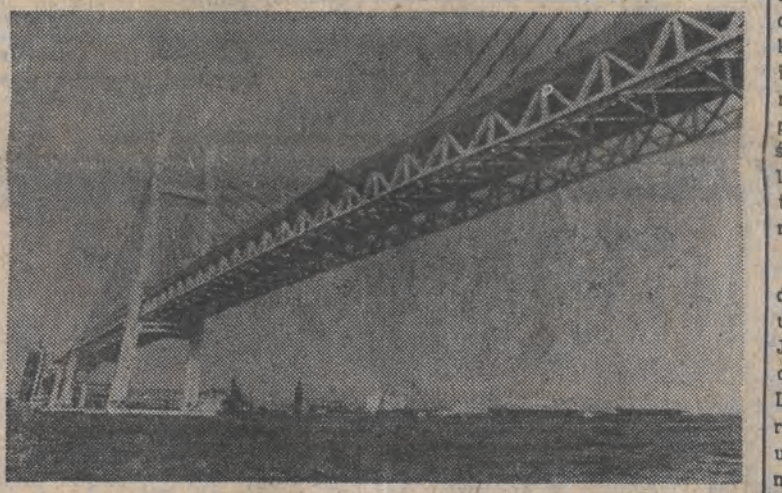
Oddany niedawno do użytku 800-metrowy most Jokohama jest drugim co do wielkości mostem linowym na świecie.

jako naruszające państwową integralność terytorialną i sprzeczne z konstytucją Litewskiej SRR oraz ustawą o rejonowych radach deputowanych.