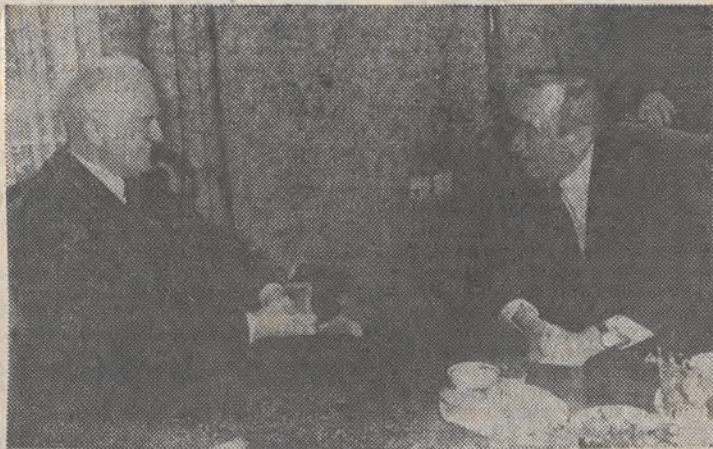
Nz. podczas spotkania.