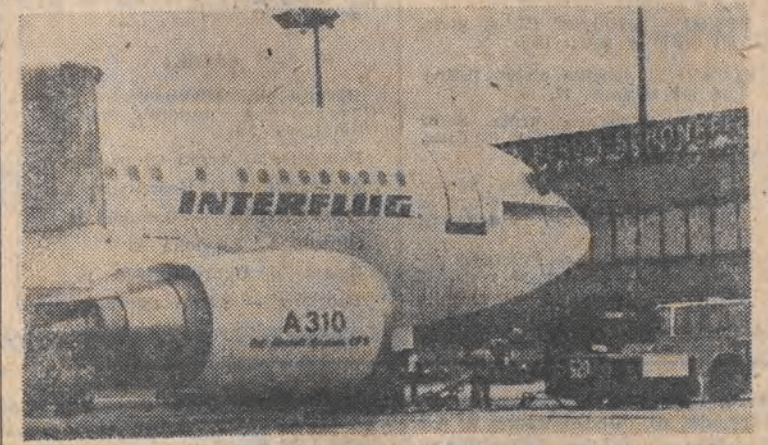
Od czerwca tego roku pierwsze „Airbusy A-310” latają w barwach energetowskich linii lotniczych „Interflug”. Na zdjęciu „A-310” na lotnisku Berlin-Schoenefeld.

Ale to jeszcze nie koniec interesujących wiadomości związanych z radzieckim lotnictwem cywilnym. Jak podała niedawno „Izwestia”, w ZSRR rozważa się kon-