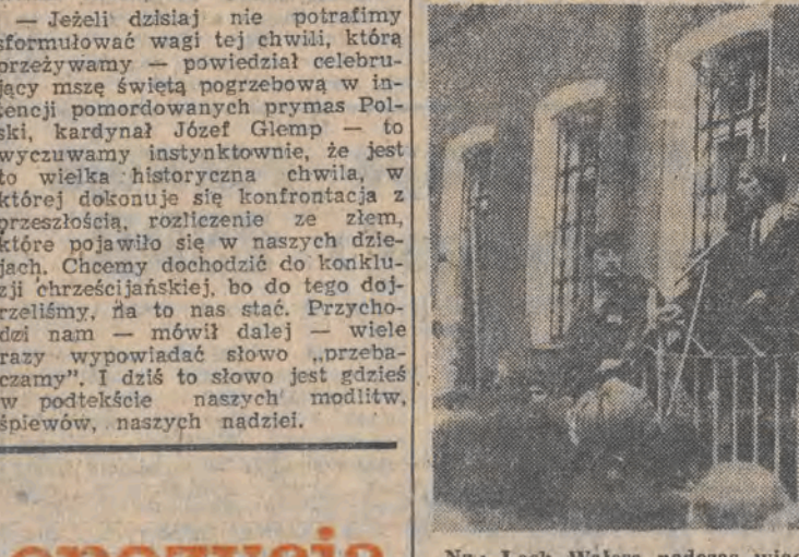
Nz.: Lech Wałęsa podczas wiecu na dziedzińcu kościoła św. Brygidy w Gdańsku, obok — Barbara Piasecka-Johnson.

Wielki tłum zbrany u stóp pomnika świętego Wacława, a także kilkanaście tysięcy zebranych na placu osób odśpiewało hymn narodowy. Rozwinięto wielki transparent z dość w tej sytuacji dalekim od pierwotnej intencji hasłem KPCZ i K. Gottwalda: „Nie pozwolimy na zagładę republiki!” Zebrani — powiewając flagami o barwach narodowych, skandowali otrzyki domagające się swobód obywatelskich i uwolnienia więźniów (DALSZY CIĄG NA STR. 2)