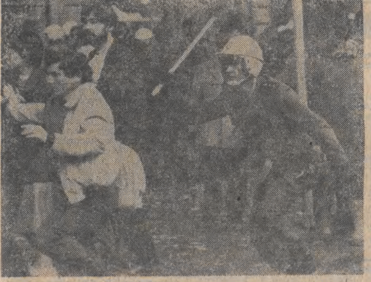
Oficer milicji w pościgu za jednym z uczestników demonstracji zorganizowanej 28 bm. na placu Wacława dla uczczenia 71 rocznicy niepodległości Czechosłowacji.