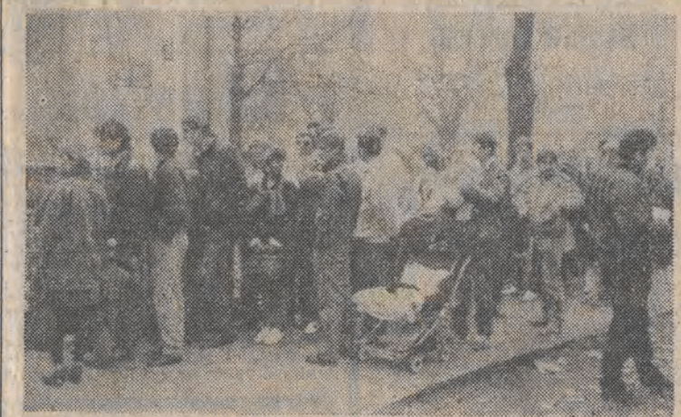
Potencjalni przesiedleńcy. W ostatnim czasie w każdą środę i czwartek pod Konsulatem NRD w Szczecinie gromadzi się pokazna grupa przeważnie młodych Polaków, starających się o pracę bądź przesiedlenie do NRD. N.z.: w kolejce po dokumenty stoja głównie ludzie młodzi.

W USA szybko rozwija się handel wodą ze źródeł i górskich strumyków, na razie nie zanieczyszczonych jeszcze odpadami przemysłowymi. Tylko w tym roku biznes przyniósł przemysłowym przedsiębiorcom 818 milionów dolarów. (opr. zg)