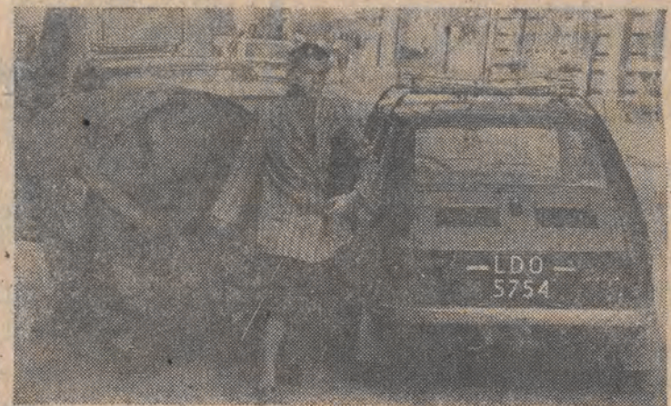
Zmora naszych ulic są obskurne pojemniki na śmieci, które najczęściej ustawiane są na ulicach, a przecież ich miejsce powinno być na podwórkach. Szpeca, cuchną i utrudniają ruch... (wach)