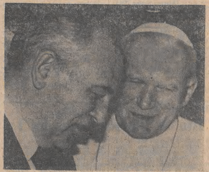
Jan Paweł II i Michał Gorbaczow podczas historycznego, pierwszego spotkania.

W piątek o godz. 10.30, na dziedzińcu pałacu Kwirynalskiego zakończyła się ceremonia pożegnania Michała Gorbaczowa przez prezydenta Włoch Francesco Cossiga. Radziecki przywódca przejechał samochodem na drugą stronę Tybru, by rozpocząć oficjalną wizytę w Watykanie.