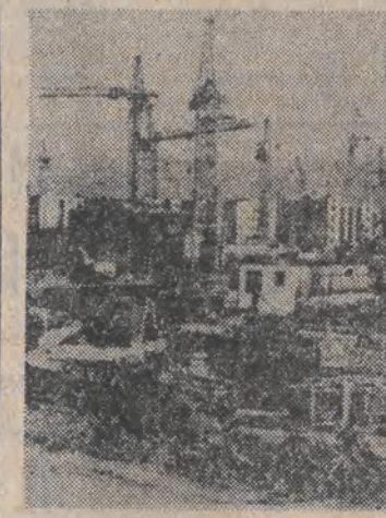
Tak wyglądał rok po trzęsieniu ziemi Leninakan w Armenii. Obecnie trwa budowa miasta.