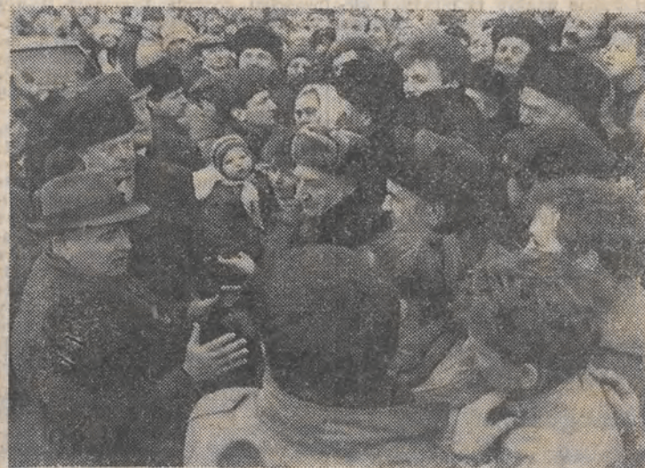
Nz.: rozmowa z mieszkańcami miasta.