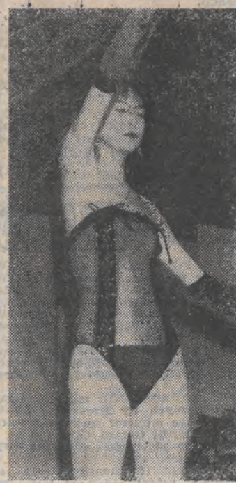
Jedną z propozycji japońskich konstruktów kąpielowych na tegoroczne lato.