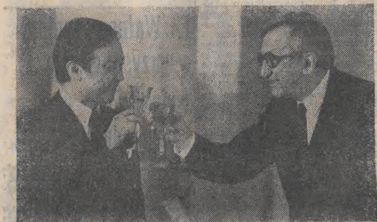
15 bm. premier Japonii — Toshiki Kaifu oraz premier Tadeusz Mazowiecki uczestniczyli we wspólnym śniadaniu. N/z.: podczas śniadania.

Dobiegła końca oficjalna wizyta w Polsce premiera Japonii Toshiki Kaifu z małżonką. Szefa rządu Japonii przyjął w Belwederze prezydent Wojciech Jaruzelski. T. Kaifu złożył też wizytę w parlamencie, gdzie przeprowadził rozmowy z marszałkami Sejmu Mikołajem Koralkiewiczem i Senatu — Andrzejem Stelmachowskim. Szefa rządu Japonii podejmował oficjalnym śniadaniem premier Tadeusz Mazowiecki.