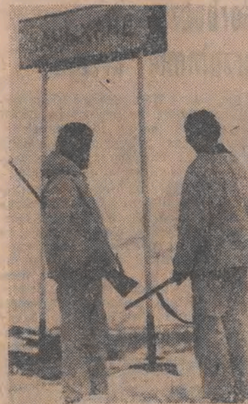
Posterunek nacjonalistów azerskich na granicy z Armenią.

PZPR deklaruje gotowość współdziałania w pracach komisji rządowej ds. ustalenia stanu prawnego majątku partii politycznych i organizacji młodzieżowych oraz odzyskania mienia państwowego z wolą rozstrzygnięcia wszystkich spornych spraw zgodną z obowiązującym prawem i potrzebami społecznymi. (PAP)