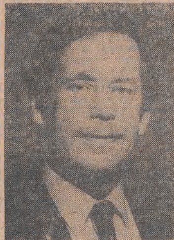
Prezydent Czechosłowacji Vaclav Havel

DZIS NA ZAPROSIENIE PREZYDENTA RP WOJCIECHA JARUZELSKIEGO OFICJALNA WIZYTA W POLSCE ZŁOZY PREZYDENT CZECHOSLOWACJI VACLAV HAVEL. Program wizyty obok rozmów z prezydentem, premierem i innymi osobistościami życia politycznego w Polsce, przewiduje wystąpienie Wojciecha Jaruzelskiego i VACLAVA HAVLA przed obu izbami polskiego parlamentu. Następująca zaledwie w trzy dni po rozmowach premiera Tadeusza