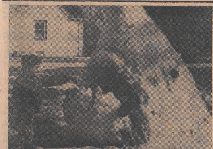
Rekin... na szczęście ze śniegu.