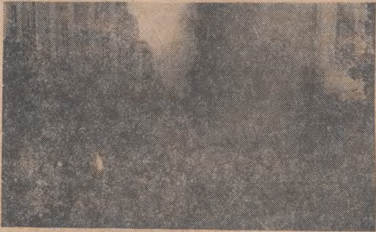
Nz: płonie jeden z budynków władz lokalnych w Duszanbe.

Co najmniej 8 osób zginęło, kiedy w środę żołnierze radzieccy ostrzelali bez uprzedzenia tłum w Duszanbe, stolicy Tadżykistanu. Jest to informacja, którą podała Agencja Reutera powołując się na doniesienia mieszkańców Duszanbe.