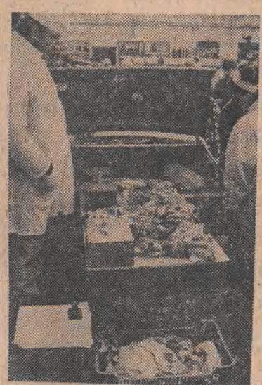
Na zdjęciu: sprzedaż mięsa z bagażnika przed DH „Magda”.

Dziś w stolicy mają być podjęte nowe decyzje w sprawie wolnego rynku mięsnego. Ja — póki co — przechodzę na wegetarianizm. (W. M.)