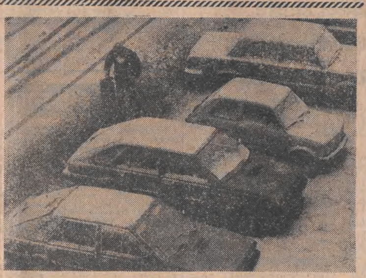
Wczoraj kierowcy — przynajmniej w Łodzi — musieli znowu sięgnąć do bagażników po miotłki. Gdyby jeszcze to samo uczynili dozorczy...

Coraz częściej w prywatnych kantorach wymiany walut w Katowicach próbuje się sprzedać fałszyfikaty banknotów dolarowych. Ostatnio w kantorze „Rubel” zakwestionowano 7 fałszywych, bardzo dobrze podrobionych, nominalnie 20-dolarowych. Papier, jakiego użyto przy ich „produkcji” jest wysokiej klasy, a fałszyfikaty zrobiono metodą kolorowej kserografii. W banknotach brak jest tzw. stalorytu, trochę inaczej „szleści” papier. Żadnych zastrzeżeń nie można jednak zgłaszać do ich barwy. Wszystko to sprawia, że dla niefachowca fałszywe 20-dolarówki trudne są do odróżnienia. (PAP)