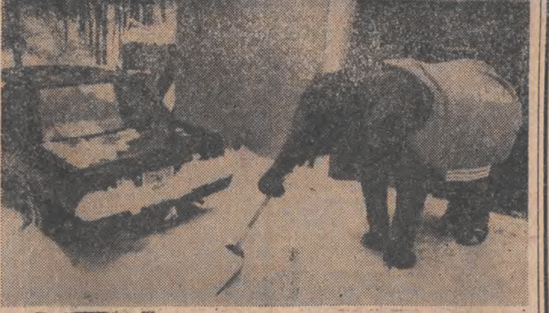
USA, 6-letnia słońca Tania z Hudson (stan New Hampshire) chętnie pomaga swemu właścicielowi w odgarnianiu śniegu sprzed garażu. Tania bierze też udział w okolicznych paradach a także w programach telewizyjnych.

PRZYPOMNIJ, NIEMIECZYŃSKA WSKAZUJE NA WSKAZANIE WSZYSTKIM: NIEKTO, LUDZIE, WYSTAWIŁ