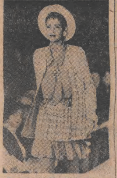
Dom mody Chanel jest wieny kostiumem w kratę...

Dalsze prace legislacyjne na tym posiedzeniu Sejmu dotyczą m.in.