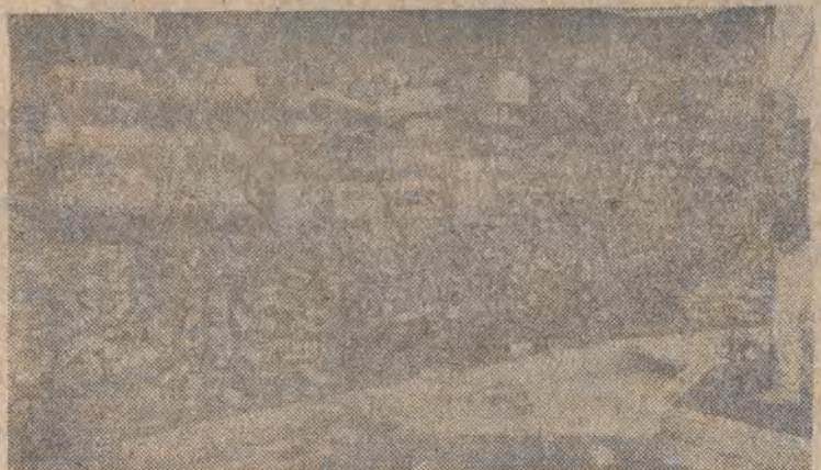
Nz.: zniszczony budynek magazynów w La Verne.

Trzęsienie ziemi spowodowało śmierć co najmniej 8 osób.