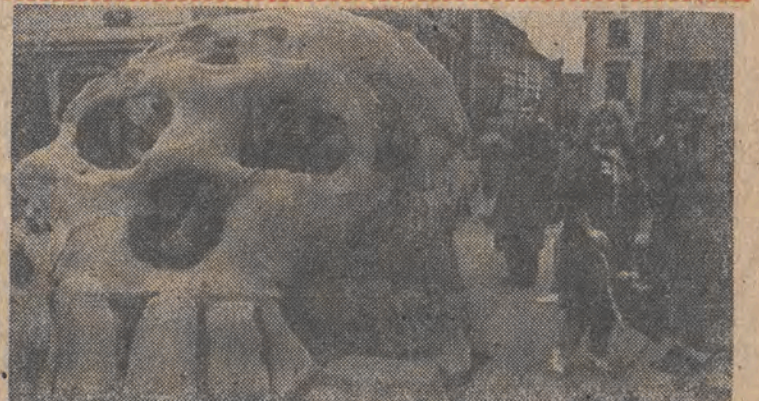
Czechosłowacki ruch ekologiczny w ten sposób protestuje przeciwko elektroniom atomowym w kraju oraz dalszemu stosowaniu szkodliwego freonu.