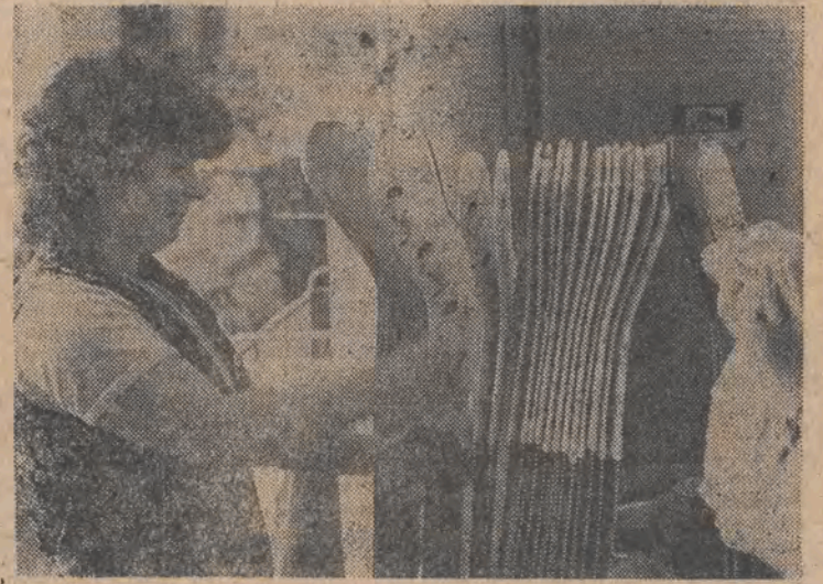
W obecnych, ciężkich czasach są zakłady, które nadal inwestują i modernizują park maszynowy. W łódzkim „Zenicie” uruchomiono produkcję skarpet dla dzieci, młodzieży i panów dzięki nowoczesnym maszynom włoskim typu Halley, firmy „RUM”. 10 sztuk tych kupionych maszyn produkuje setki tysięcy skarpetek. Te najnowsze i najczystsze w naszym kraju maszyny dają możliwość uzyskania nieograniczonej ilości nowoczesnych wzorów — zdobień na produkowanych skarpetkach, w sześciu kolorach.

To, co się dzieje od roku i natężyło się z tygodnia na tydzień od stycznia br. — budzi społeczną grozę. Bandyty, w przeważającej części bardzo młodzi — są bezwzględni w stosunku do swych ofiar i ich agresja grozi zdrowiu i życiu ludzkiemu. Wstrząsającym tego przykładem była napad trzech osobników, którzy w Łodzi, zeszłego