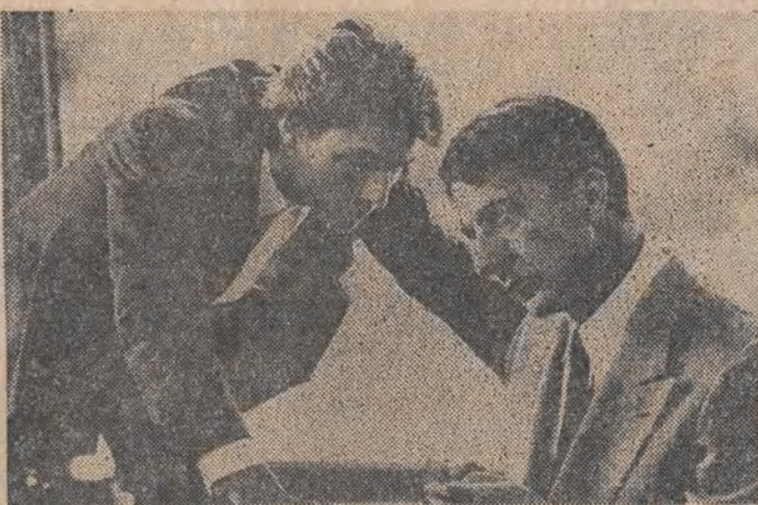
Tom Cruise i Dustin Hoffman w głośnym filmie Barry'ego Levinsona „Rain Man”.

J eśli przyjąć, że „Konfrontacje” stanowią i tym razem forpoczty repertuaru na bieżący rok, to trzeba rzec, iż przyszedł czas na ekranową solidną produkcję. Superszlagier, przed którego projekcją lamano by sobie koci u kinowych wejść, nie było. Jednak najgłośniejsze pozycje o światowej renomie nie zawiodły. „RAIN MAN” reż. Barry'ego Levinsona zabłysnął kreacjami Dustina Hoffmana i Toma Cruise'a. Choć narracja tu powolna, atmosfera kameralna, dla tych, którzy lubią opowieści odkrywające ludzkie wnętrza, była to propozycja dużej wagi.