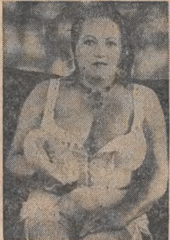
Marianne Saegbrecht w filmie „Bagdad Cafe”.