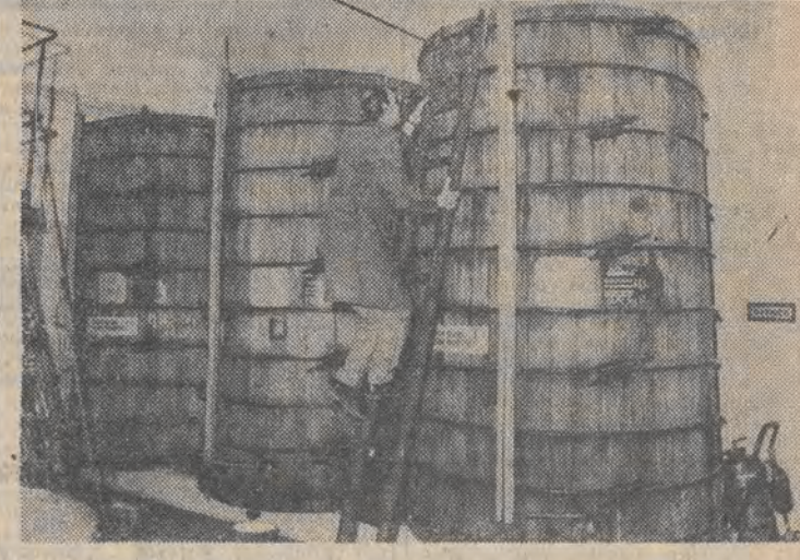
Od kwietnia 1988 roku w Bielsku-Białej wytwarzane są przez spółkę Polish-Kosher wódki koszerne, to znaczy czyste wg odpowiednich przepisów rytualnych, produkowane w sterylnych warunkach, ze zboża lub ziemniaków. Produkcja jest systematycznie nadzorowana przez dwóch rabinów, którzy przyjeżdżają do Bielska. Koszerne wódki cieszą się powodzeniem wśród krajowych i zagranicznych amatorów mocnych trunków, niezależnie od ich wyznania.

Na zdjęciu — w takich beczkach przygotowuje się śliwowiec — „pejsachówkę”.