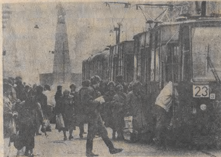
Ul. Nowowiejska w godzinach szczytu.

Lektura okazała się pouczająca. Doszedłem bowiem do wniosku, że skoro już nie ma PRL, to w Rzeczypospolitej można sobie kpić z klienta. Wszak przepisy się dezaktualizowały i dziś nie dotyczą PANÓW ze stacji obsługi samochodów. K. Z. (nazwisko i adres do wiadomości redakcji)