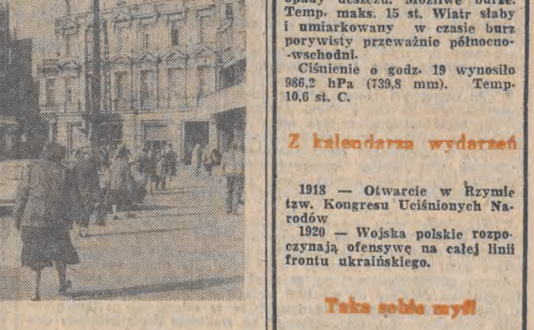
Plac Wolności.

obu organizmów narodowych, prawnych i gospodarczych. Otwarcie się Czechosłowacji na Zachód jest widoczne w Brnie chociażby policzbie samochodów z rejestracją austriacką i RFN. Również na targach dominują wystawcy z tych dwóch państw. Wiadą jednak i wzrastającą aktywność kupiecką państw — członków RWPG, do niedawna najważniejszych współpracowników gospodarczych Czechosłowacji. Co prawda na ten rok podpisane zo-