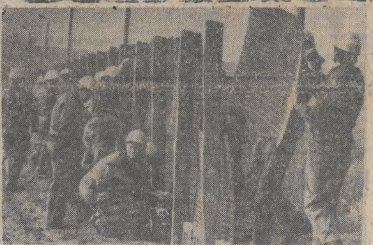
Grupa ochotników ze strazy pożarnej w NRD i RFN wspólnie — po raz pierwszy — przystąpiła do rozbiórki umocnień granicznych między swymi krajami.