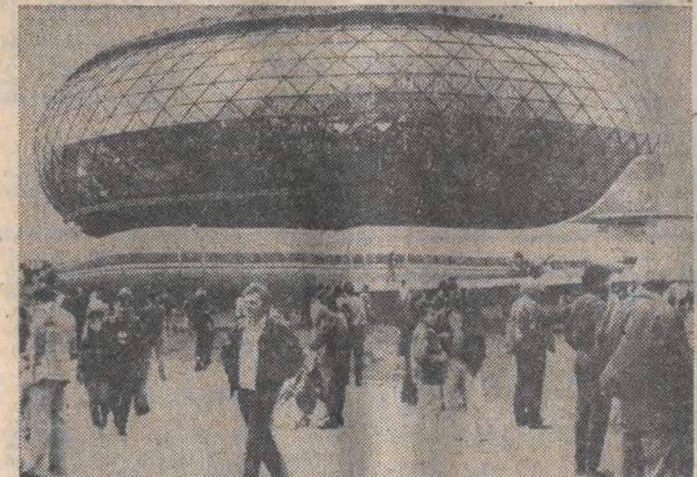
Nagrodę dziennika „Borba” w dziedzinie architektury otrzymali projektanci gmachu muzeum lotnictwa w Belgradzie.

— Niech pan opowie naszym czytelnikom jak to się stało?