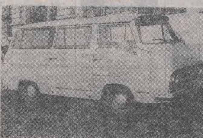
Na polskich drogach ten samochód jest prawie nie spotykany — za to u naszych południowych sąsiadów skodę 1203 widzi się bardzo często.

Powstaje ona w filii zakładów produkujących osobowe skody w Trawnie. Wykonuje się ją także w wersji sanitarnej i mikrobusa. Skoda 1203 ma silnik czterocyliniowy o pojemności 1221 cm sześć, i może zabierać ładunek do 800 kg.