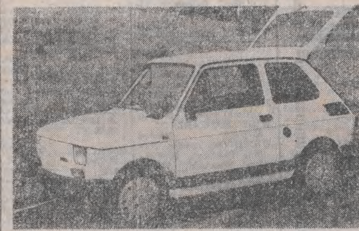
Na zdjęciu: Fiat 126 bis jest modelem przejściowym. Ciekawe ile jego podzespołów przejdzie do „Iksa”?

Kolejka posiadaczy przedpłat na fiata 126p będzie liczyła jeszcze przynajmniej kilkudziesiąt tysięcy osób. a w Fabryce Samochodów Małolitrażowych będą już wydawane „Iksy”. W tych dniach poszła w Polskę wieść o rozpoczęciu (po 15 maja) sprzedaży obligacji, które umożliwią zakup nowego samochodu — następcy fiata 126p.