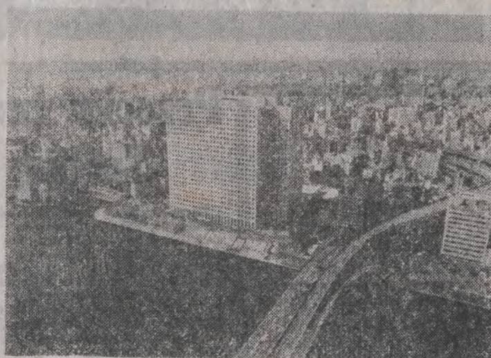
Wieżowiec IBM nad rzeką Sumide zbudowano w 24 miesiące. To jest japońskie tempo!

zrobił jednak wzniesiony w początkach lat siedemdziesiątych