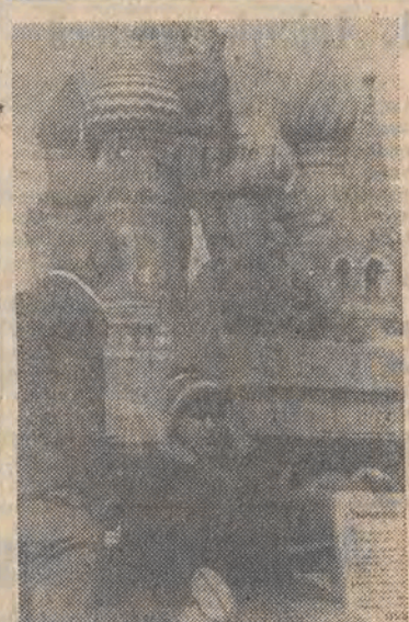
ZSRR. Wiktor Iwanowicz podjął głodówkę na Placu Czerwonym w Moskwie przeciwko planowanej drastycznej podwyżce cen żywności.

tego miasta. Pełnomocnik rządu ds. reformy PKP Ewaryst Waligórski przedstawił harmonogram wdrażania programu restrukturyzacji przedsiębiorstw PKP i tryb zmian personalnych. W godzinach popołudniowych rozmowy zostały przerwane. Krajowa Sekcja Kolejarzy NSZZ „Solidarność” (DALSZY CIĄG NA STR. 3.)