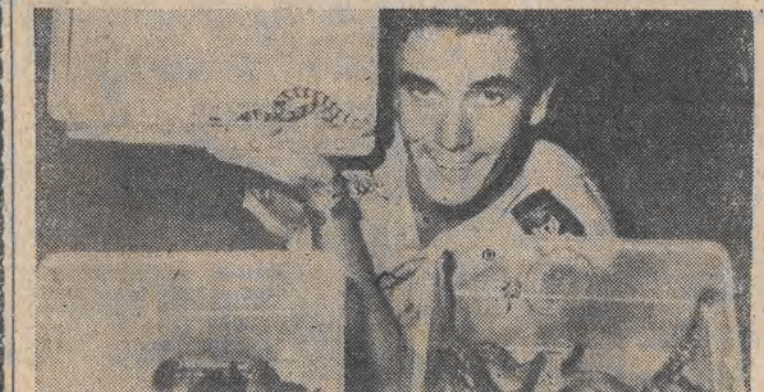
Zarobić można także na przemyśle... węży. Ostatnio wykryte taki szmugiel w paczkach wysyłanych z RPA do Holandii.